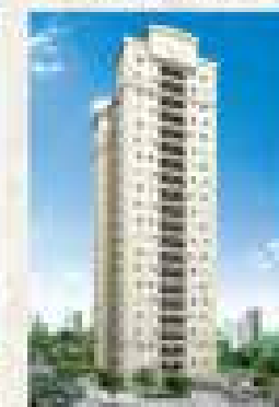
Convento Pq. Jaqueiras - São Ambrósio