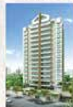
Sport House Via Mariana - SBC