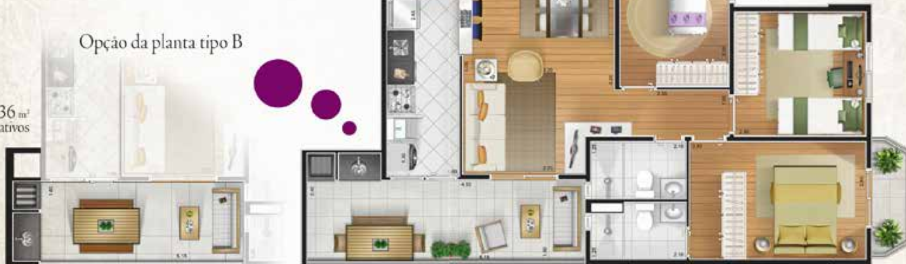
For greater details of the plan, go to B. Or contact a consultant at our website, in the field of interest.