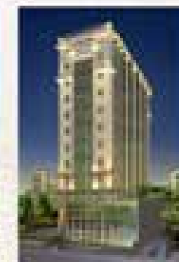
Centro Empresarial Saneamento Rudge Ramos - SBC