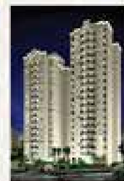
Intercorretiva Park Springe