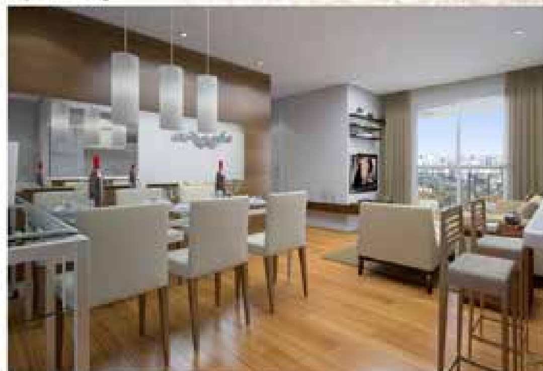
Projeção e vista de living