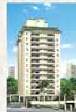
Celebration Rudge Ramos - SBC