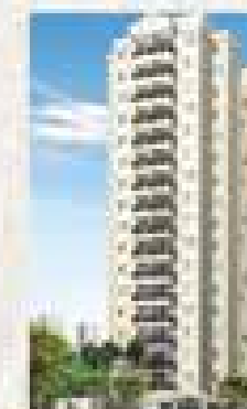
Classic Via Conselheiro - SBC