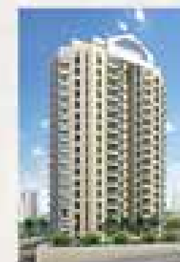
Maxima Av. das Américas - SBC