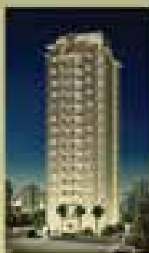
Elegance Springs Springs - SP