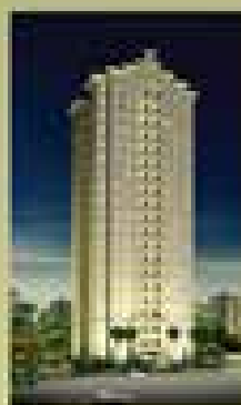
La Grand Maison V. Monumento - SP

Com inúmeros imóveis na região da ABC capital, interior e litoral de São Paulo, a M. Bigucci destaca-se entre os 10 maiores construtores do Estado de São Paulo, e tem como maior patrimônio a satisfação de seus clientes. Certificada pelo ISO 9001, é reconhecida por sua excelência e qualidade através dos mais diversos prêmios.