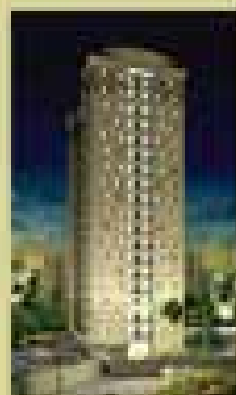
Espazo Dell'Arte S. Constança - S. André