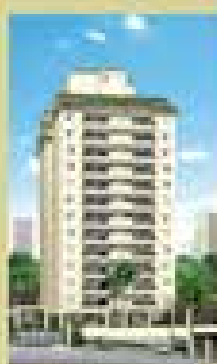
Celebration Fudge Romo - SP