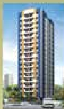
Duplex de Anjo Monte Villa - SP