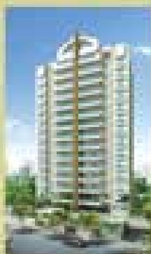
Spectacolo Via Mariana - SP