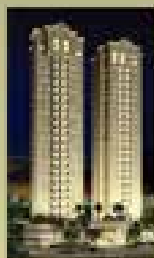
Top Life Fudge Romo - SP