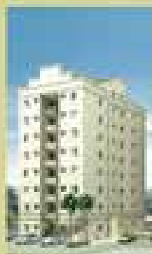
Villa Bonheur Demachi - SP