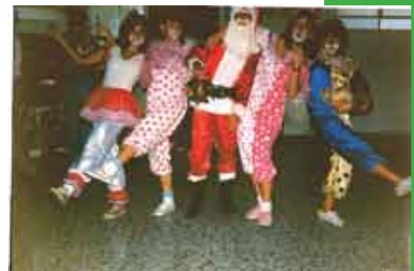
Festa de natal realizada no Lar Escola Pequeno Leão em dezembro de 1986