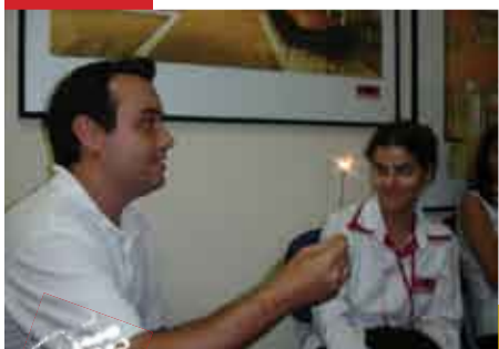
Curso: Técnicas de contar histórias