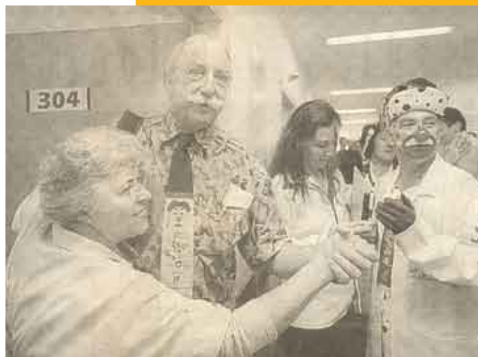
Dr. Patch Adams em visita ao Hospital Municipal Universitário, em São Bernardo do Campo

Nossos agradecimentos a todos que participam deste projeto de responsabilidade social.