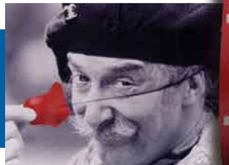
Dr. Patch Adams – O inspirador do filme - Workshop dado em 2003