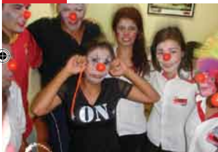
Aprendendo com os palhaços do curso municipal de circo.