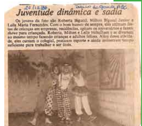
Matéria publicada no Diário do Grande ABC sobre a Turma Pirulito em dezembro de 1986