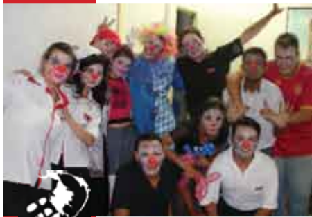
Aulas de Brincadeiras

Hoje os palhaços do Grupo Big Riso, que atuam na Ala de Oncologia Infantil no Hospital do Centro Universitário Fundação Santo André, levam alegria e tranquilidade a todas as crianças e adolescentes que lá estão para fazer o tratamento. Eles possuem importância significativa no trabalho desempenhado por todos os profissionais que lá atuam, que vai desde toda equipe médica, passando pelos psicólogos, assistentes sociais, enfermeiros até voluntários.