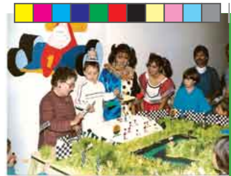
A festa na casa da professora em agosto de 1986

Em julho de 2002, fizemos uma apresentação deste filme na M. Bigucci, empresa em que eu já trabalhava, e logo após perguntamos se alguém tinha interesse em fazer esse tipo de trabalho na empresa. Muitos se empolgaram e então começou a minha busca de informações. Primeiro fui atrás de uma equipe já tradicional na área, mas eles não aceitavam voluntários, pois é necessário um curso. Depois descobri uma pessoa que