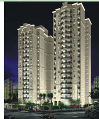
Perpectiva artística da fachada

Empreendimento já é considerado ponto de referência da Região do Ipiranga