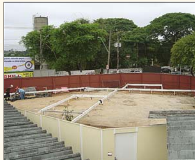
Centro Empresarial Roberto S A Bigucci Rudge Ramos – SBC