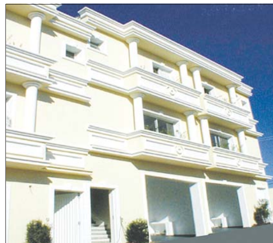
Portal dos Nobres

É assim que a M.Bigucci trabalha – fazendo e comprovando sua capacidade e excelência em produtos e serviços sejam nos mais modernos sejam nos mais clássicos!