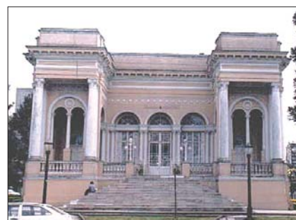
Câmara Municipal de Curitiba

cionando assim aos seus clientes, o conforto da modernidade com a elegância e o requinte do passado.