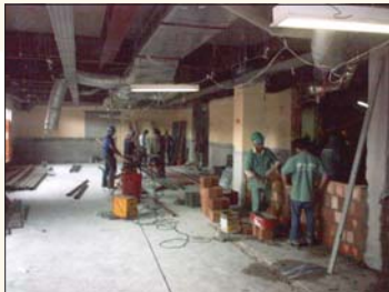
Habib's João Dias Santo Amaro - SP

Fundações ..... 100% Estrutura ..... 100% Alvenaria ..... 100% Fachada ..... 80% Instalações ..... 85% Acabamento ..... 75%