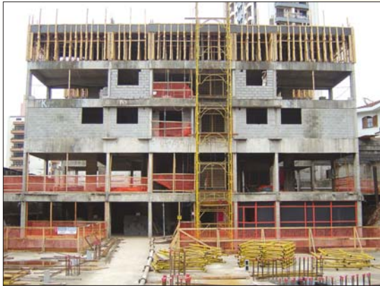
Grand Park Saúde – São Paulo

Fundações ..... 80% Estrutura ..... 25% Alvenaria ..... 5%