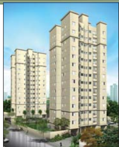
Perpectiva artística da fachada