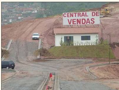
Loteamento Jardim Paulista Itapecerica da Serra – SP

Fundações ..... 100% Estrutura ..... 100% Alvenaria ..... 100% Fachada ..... 100% Instalações ..... 100% Acabamento ..... 90%