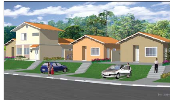
Concepção artística da fachada

risco de crédito Geric B – fornecida pela Caixa Econômica Federal somente às empresas que possuem credibilidade e força.