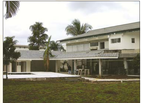
Residência Guarujá - SP

Fundações ..... 100% Estrutura ..... 100% Alvenaria ..... 100% Fachada ..... 90% Instalações ..... 60% Acabamento ..... 40%