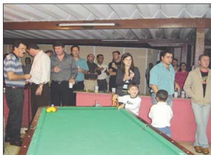
Funcionários comemoram mais uma conquista na atlélica M.Bigucci

Essa é uma preocupação primordial para M.Bigucci, pois a Certificação ISO assegura a qualidade em altos níveis, garantindo ain-