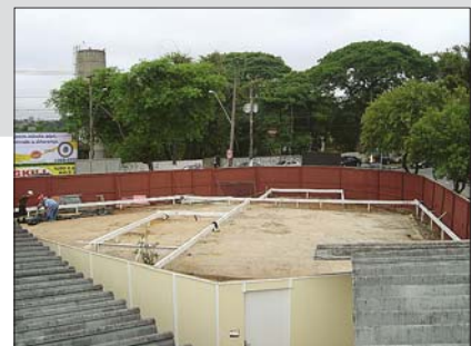
Foto do local

Maiores informações podem ser obtidas pelo telefone : (11) 4367-8600 (Departamento de vendas ou locação) ou via e-mail : mbugucci@mbugucci.com.br .