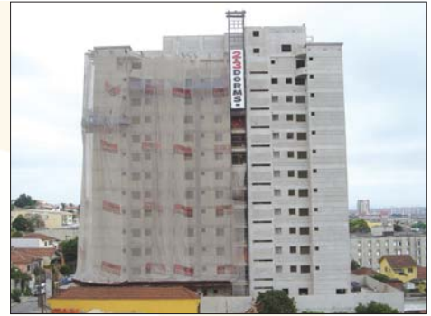
Morada Campestre B.Campestre – Sto André

Fundações ..... 80% Estrutura ..... 25% Alvenaria ..... 5%